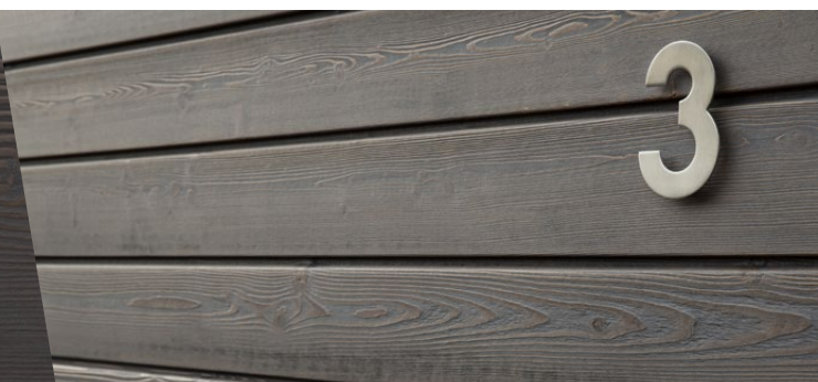
Bardage Protect Gris Equinox, profil Line